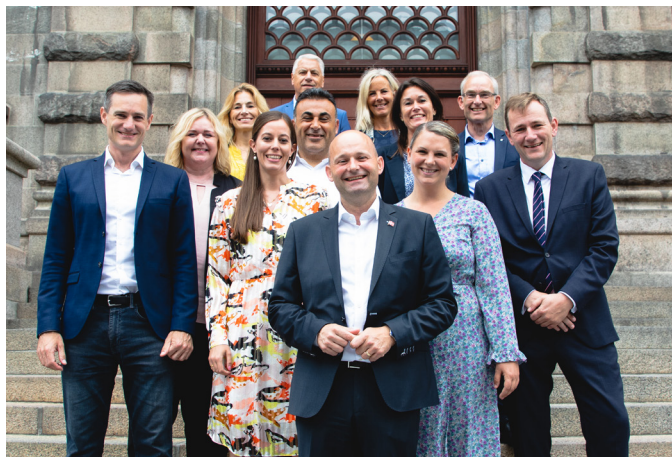
Den nye folketingsgruppe på 12 medlemmer foran Christiansborg.