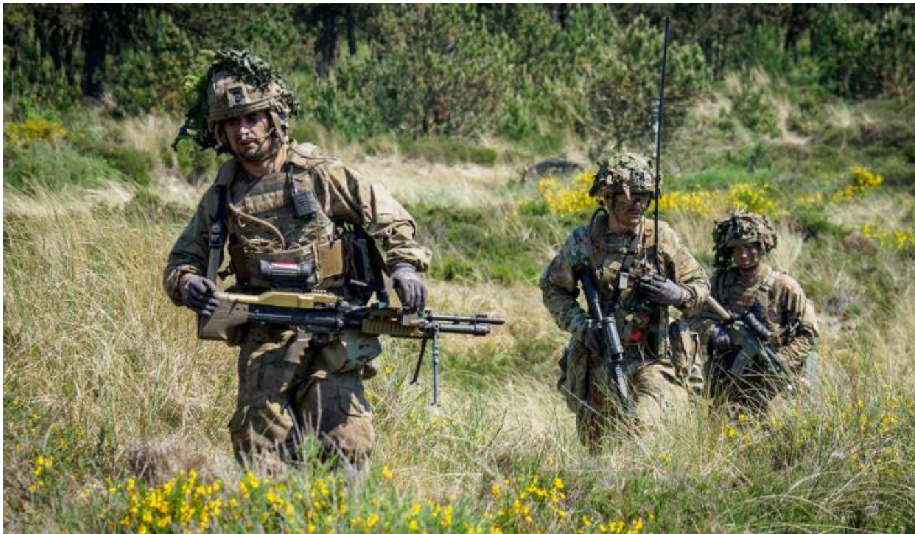
Genrebillede fra Forsvarsgalleriet.

med lidt beherskelses fra Rasmus Jarlov. Med det nye forsvarsforlig øges forsvarsbudgettet, det er godt. Men som Rasmus Jarlov siger, vi ville gerne have mere. Det var vi det eneste parti, der ytrede. Hvorfor så det? Fordi med forliget og en tillægsaftale i 2019 er Danmarks samlede forsvarsudgifter i 2023 oppe på 1,5% af BNP.