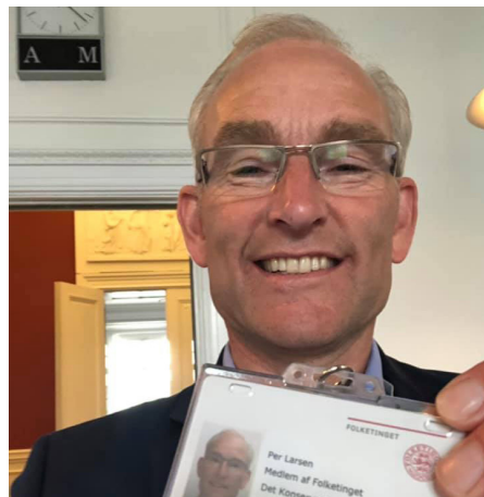
Glæden var ikke til at skjule, da det nye adgangskort kom i hus.

le op, og det sagde jeg ja til. For jeg kunne mærke, at jeg brænder så meget for sundhedspolitikken, og at der er nogle alvorlige udfordringer i vores sundhedsvæsen, som jeg gerne vil bidrage til at løse, at jeg bare var nødt til at stille op.