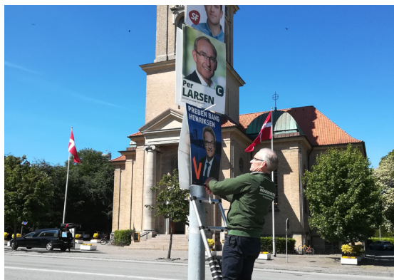
Det var bestemt ikke for at få et godt Facebook-opslag, at vi rettede på Venstres plakat :-).

Her skal jeg nok blive glad for at være.